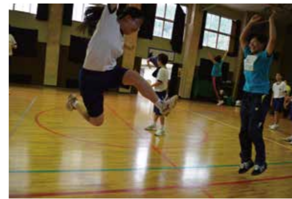
浦城小学校に近接する浦城中学校でもダンスワークショップを実施しました。目的は、小中一貫教育。

※【実施校等】【実施内容】【講師】【主催等】【協力】等は第1回～第4回と特に変更なし