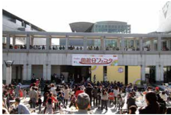
劇場から依頼を受けて、ダンスフラッシュモブをつくりました。附属幼稚園、宮崎大学の学生、一般等、参加者多数。