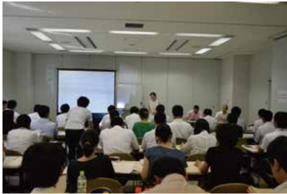
先生と一緒に考えたこと 10年先の体育=現代芸術的体育