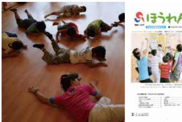
いわきアリオスとの初仕事。