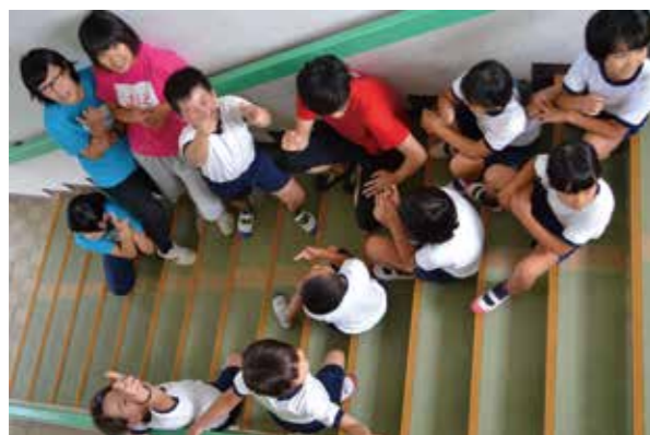
8人のスパイ(浦城小の子供たち)が学校のあちこちで暗躍した2時間でした。