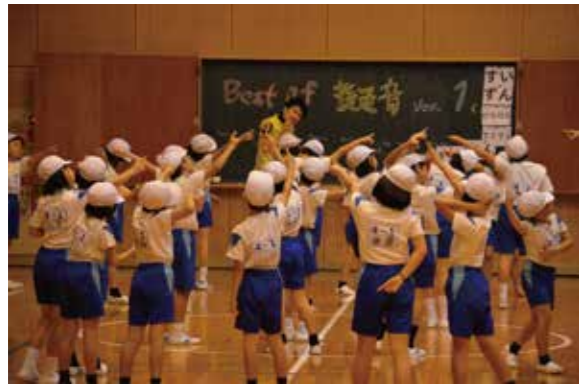
4年生を対象に「現代芸術的体育」を実施しました。 キーワードは、「コミュニケーション」「芸術家と教員」 「脱学習」「体育」