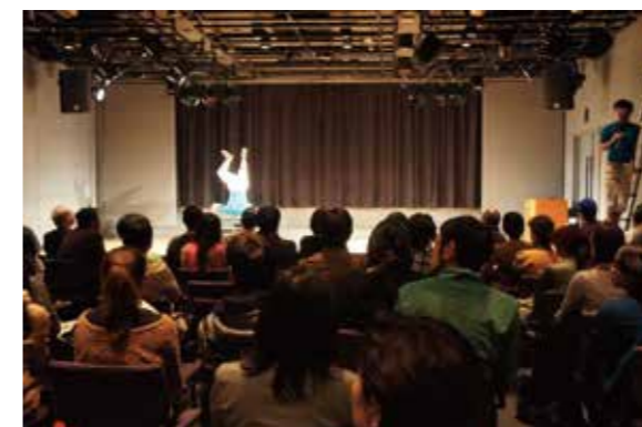
ゲストアーティストとして、んまつーボスがパフォーマンスを 披露。MIYAZAKI C-DANCE CENTERのプレゼンもしっかりできました。