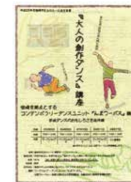
学校ダンスのおもしろさを追体験。 最終日にホールで成果発表を行いました。