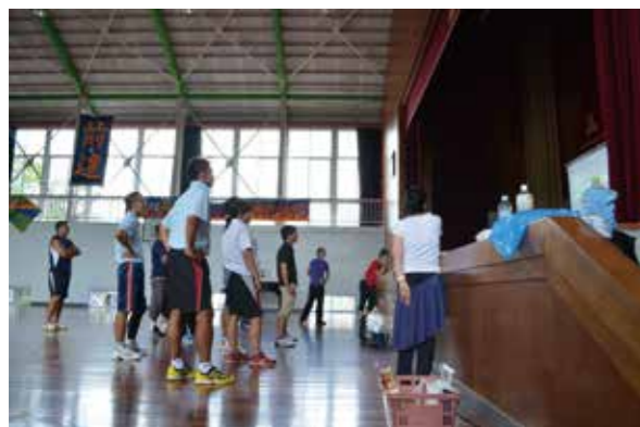
盛夏。クーラーのない体育館で体育の先生がクリエイション