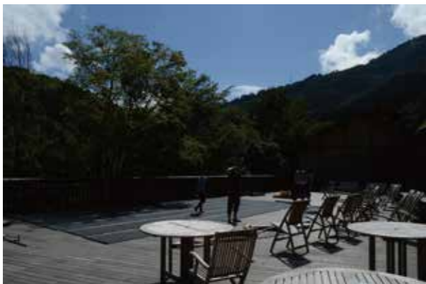
「村」での初開催。途中で雨が降り、屋外から屋内へ！何でもありのパフォーマンス・パーティー！