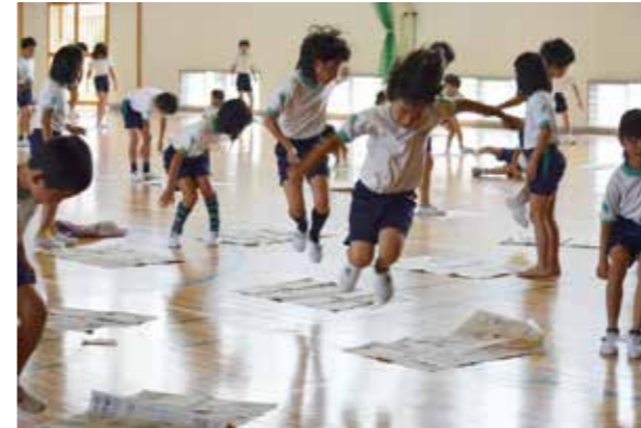
小林市(ハンドボールの町)での初仕事 小林小の3年生104名 さすがさすがの運動神経