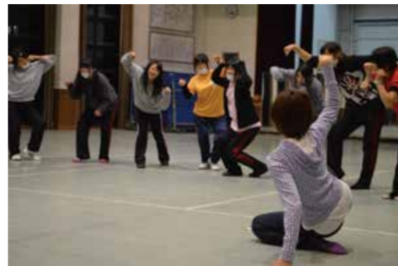
NP0法人が主催し、若手新進芸術家を学校に派遣。高校生・教員と芸術家を出会わせる。