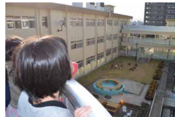
自分たちで創った「オリジナルダンスフラッシュモブ」を さて、どこで踊ろうか?キーワードは、「コミュニケーション」 「芸術家と教員」「グルーピング」「特別活動(学級活動)」。