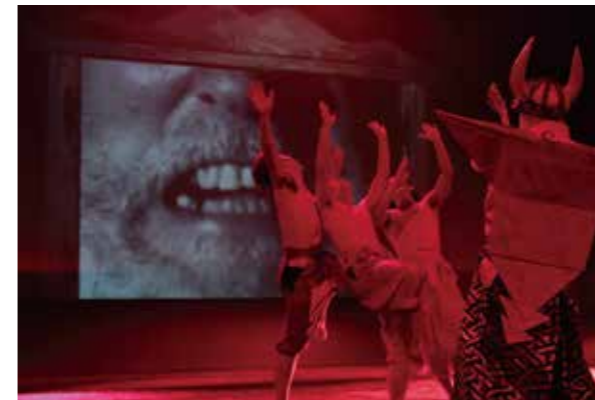
初全国公募(3枠)の団体に「んまつーポス」が選出。 上演作品は「んまつーポス いっすんぼうし」です。

[事業名] WATAGATA ARTS FESTIVAL Asia Art Producer Network Forum Vol.1 [主催等] WATAGATA 福岡ブサンアートネットワーク福岡事務局 [会場] 釜山広域市付近 [担当・WS講師] 児玉孝文