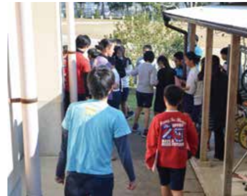
初めての試み(校歌ダンスフラッシュモブ)を实践。 できあがった校歌ダンスを使って、 校長先生を驚かせることができました。