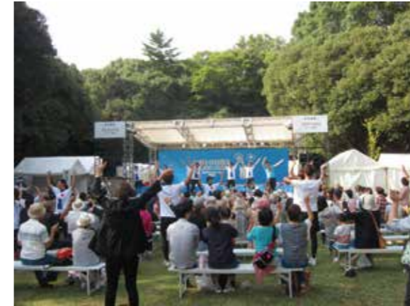
えれこっちゃんみやざき2013の一般部門で受賞(権原賞) 権原市で受賞作品を披露しました！