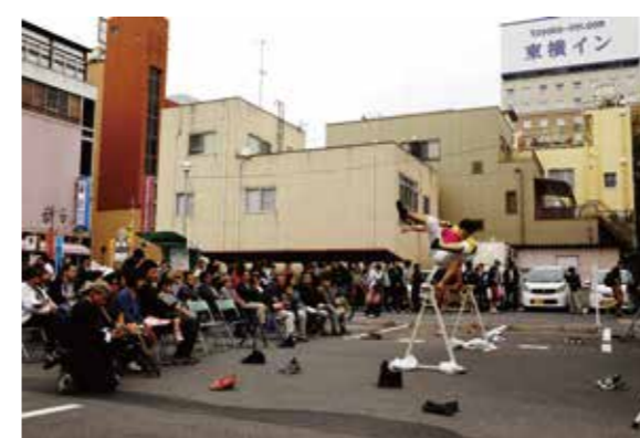
いわき市内でパフォーマンス！ んまつーボス Japan ツアーの宣伝もできました！