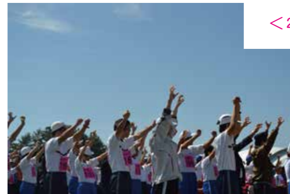
毎年恒例！晴れやかなオープニングを演出。このオープニングは県知事や県議員などの列席者も一緒に踊ります。