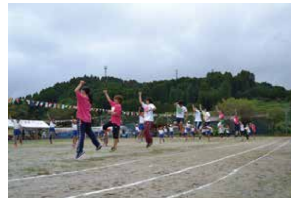
毎年恒例となっている鏡洲小学校（宮崎市）運動会。そのオープニング（Mキッズエクササイズ）を演じました。