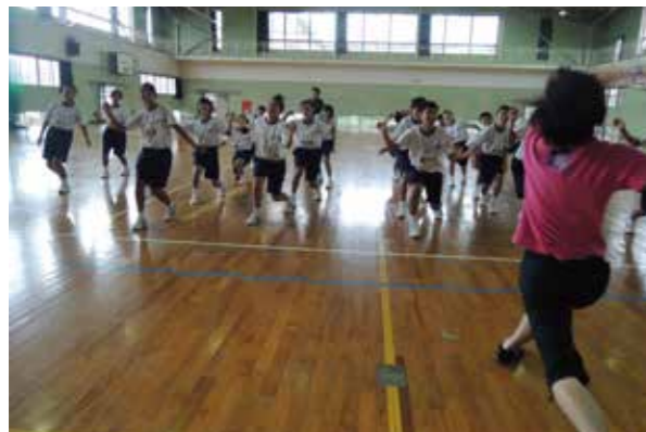
昨年に続いて今年度もオファーがありました。でも武道と比べたら・・・