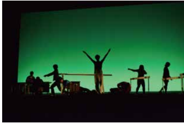
宮崎大学から招待状（タダのダンスじゃないけど、あなたはタダ）子どもたちや市民のためのアートの場