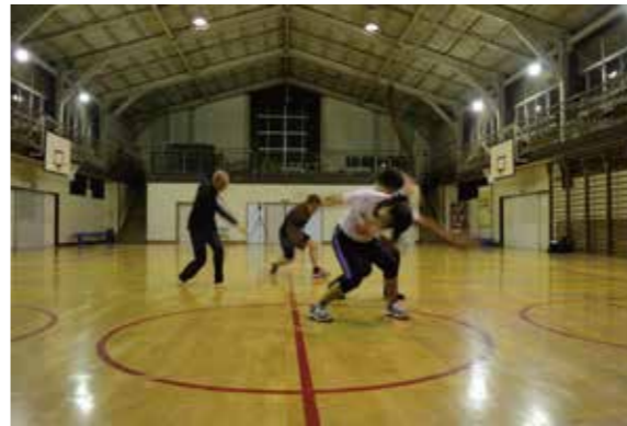
いわき市で、ようやく、それも夜の7時から、現職教員等を対象としたダンスワークショップができました。