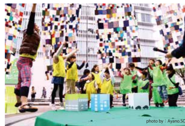
協力した以上に得たものが大のワークショップでした。