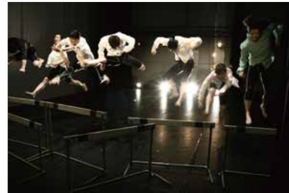
ツアーの最終地。広島にんまつーポスの足跡を残すことができました。