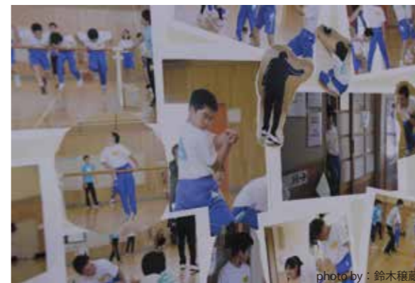
時間をたくさんかけて実践してきた「現代芸術的体育」について、子供と教員、劇場スタッフと一緒に考えました。

【事業名】 スクールコンサート 【実施校等】 串間市市木小学校 (児童数:24名、教員数:6名) 【実施内容】 コンテンポラリー・ダンスの鑑賞教室 【芸術家等】 んまつー波斯、片山敦郎(補助) 【主催等】 社団法人 宮崎県教職員互助会 【協力】 舞踊学研究室 【その他】 地域の教育団体等との連携・協力