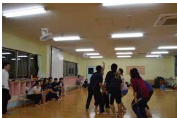
NP0法人主催事業「未来ダンス・ワークショップ」シリーズ2014の第1弾。ゲストアーティストは、「プロジェクト大山」の3名!