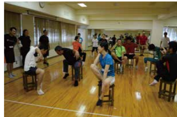
「ダンスについて、立ち止まって考える時間になった」(男性教員)