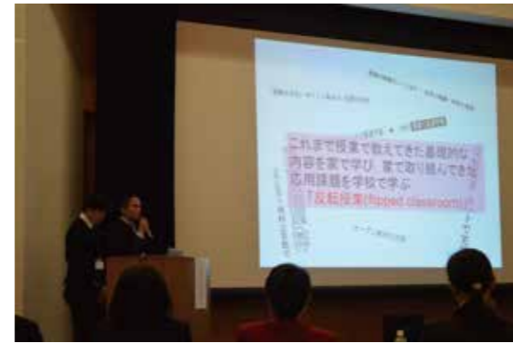
舞踊学会でMIYAZAKI C-DANCE CENTERが論文発表。演台：芸術家の新しい活用（ダンスフラッシュモブを学校に）