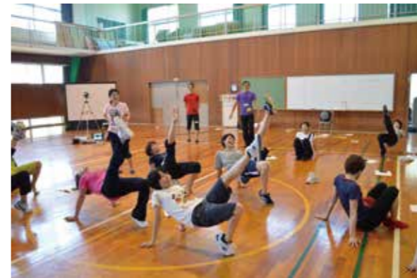
答えのないクリエイションの面白さを子どもたちへ 還元すること。このセミナーの目的です。