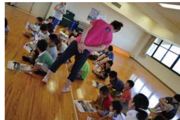
子供たちの先に、大学の知 他学部の大学教員に活動を知ってもらうチャンス