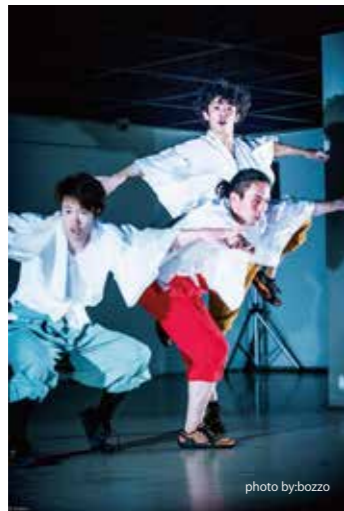
参加した振付家が、自らプロデュース、プロモーションするショーケースに今年も参加。大雪で白銀の世界でした。