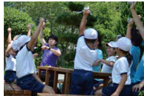
学校体育はどこへ行く? いよいよ始まりました。 小井小・中学校の子供たちと浦城小の子供たちと交流。