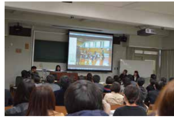
アート（芸術）とアート（指導力）の出会い