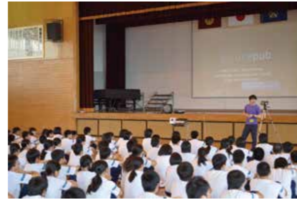
2年生は修学旅行中 その静かな校内で3年生が「ダンスフラッシュモブ」を踊りました。