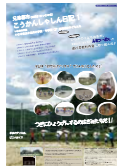
いわきポスター (第1回目/6回)

<プロジェクト> [主催等] いわき市と延岡市をつなぎ広げる実行委員会 宮崎大学「とっても元気!宮大チャレンジプログラム2013」 [実施内容] 1. ダンスワークショップの実施 (@90分×6回) 講師: んまつー波斯 実施校他: 延岡市立浦城小学校の全校生徒(8名) いわき市立小白井小学校・中学校(7名) 期間: 2013年6月24日(月)～10月20日(日) 会場: 同小学校体育館、他 2. ポスターのデザイン・制作及び配布 サイズ: A1 枚数等: @200枚×13種類 配布先: 延岡市の小学校(31校)、いわき市の小学校(74校) 3. ポスター展の開催 ・宮崎大学小中一貫教育支援プロジェクト 「小中一貫教育フォーラム」(2013.12.8) 会場(宮崎市民プラザオラブルイトホール) ・「んまつー波斯 JAPAN ツアー2014」 会場(いわき、東京、広島) [協力] いわき芸術交流館アリオス(ポスター配布) 延岡市教育委員会(同) 宮崎大学教育文化学部舞踊学研究室(教材の提供他) ※以下、「舞踊学研究室」 [その他] 地域の大学との連携・協力