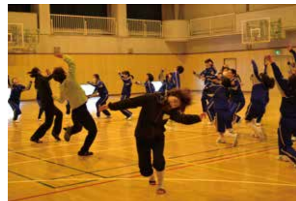
生徒達からおもしろいアイデアがどんどん湧き出てきて… 時間に限りがなければ、どこまでもいような時間でした。