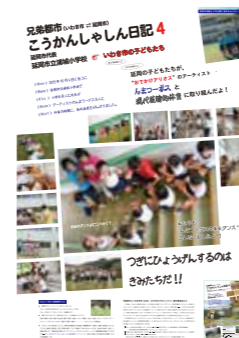
延岡ポスター (第4回目/6回)