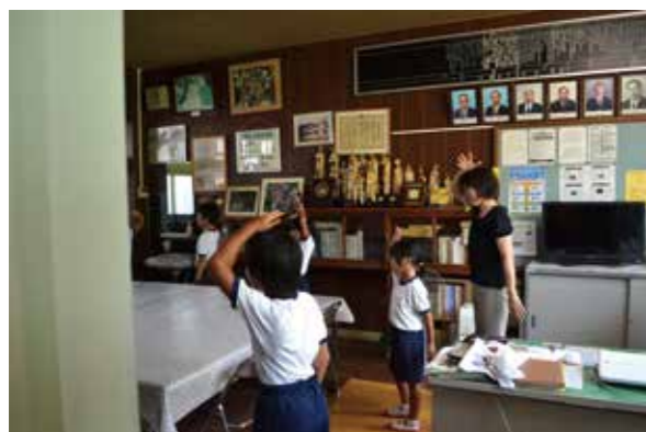
学校体育はどこへ行く？ 浦城小のオリジナルダンスモブもできました。 夏休みの登校日に実施！！