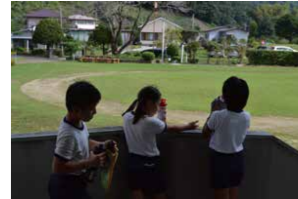
1年生の2人も「Get on your dancing shoes?」にトライ。正解のないおもしろさを満喫しました。