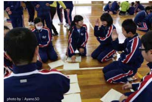
まさにコミュニケーション能力の育成 異学年の関わりから生まれてくることがたくさん見えました。