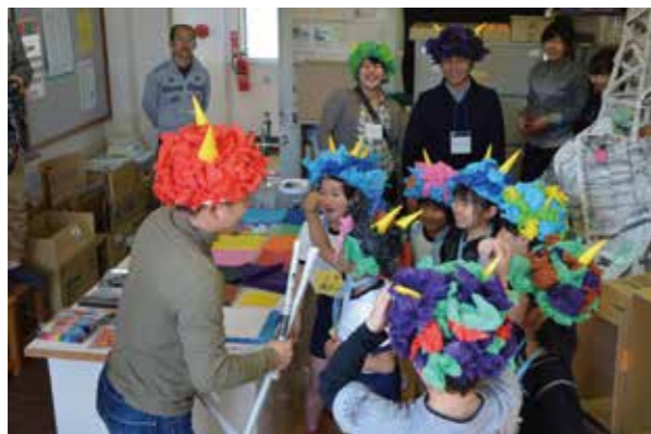
コーディネート事業の2番手は図画工作でした。