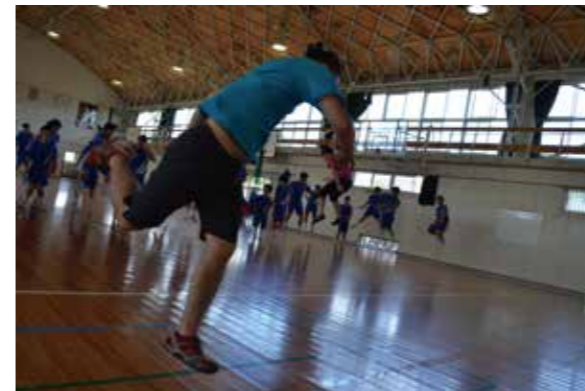
「生徒と一緒に間近で鑑賞できて、言葉になりません！」 (先生の感想)