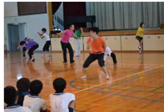
埼玉県「表現・ダンス」夏期体育実技講習会」で実施した内容を、川越の子供たちに実践することができました。