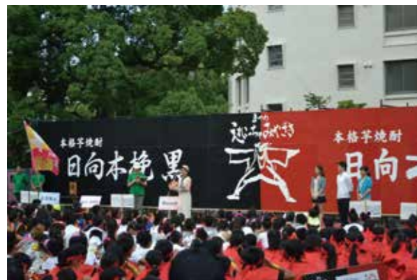
今年も、えれこっちゃんみやざき2013に協力しました。 たくさんの子供たちが、表彰式の講評に耳を傾けました。