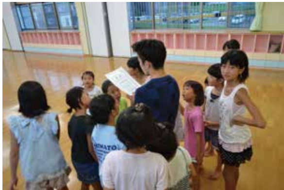
たまには子供たち（キッズ☆スター）とカーニバルで踊るのもいいですね。しかも、実行委員長賞！