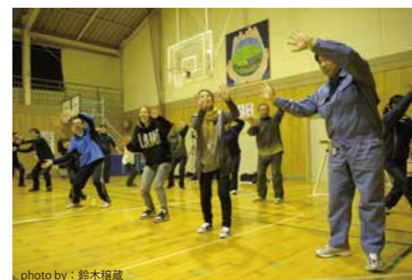
小白井小・中学校の子供たちへのサプライズ企画。子供たちには内緒。保護者のみなさんがこっそり学校に集まり、夜のワークショップ。

※【実施校等】【実施内容】【講師】【主催等】【協力】は第1回～第3回と特に変更なし