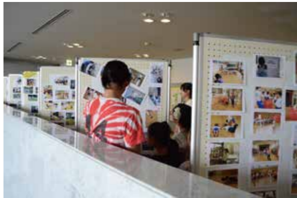
「延岡市といわき市をつなぎ、ひろげる」プロジェクトが写真を開催しました（上）。宮崎大学学生の協力のもと、地域の方々を巻き込んだダンスフラッシュモブを実施（右上）。