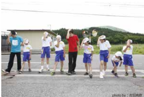
全校生徒7名の極小規模校だからできること 新しい連携(学校+劇場+芸術家+大学)がスタート