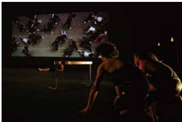
「いわきの地に立ちそこで感じたこと 改めてダンスについて考えたこと」を中核に、大学生振付家ダンサーの小作品と群舞（トカゲのノスタルジア）で、構成・演出。2日間2公演。