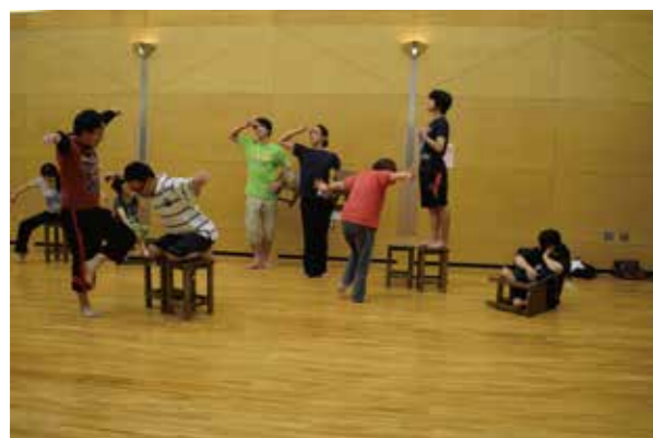
劇場との連携。「演劇の学校」の中で、んまつーボスの 身体表現ワークショップを実施しました。(一コマ)