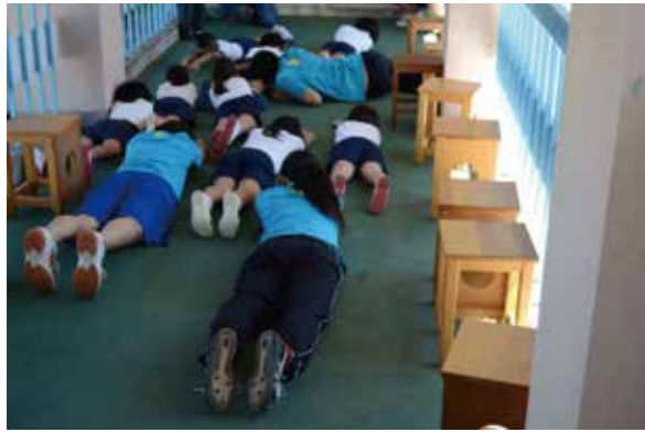
理科室にある椅子を使った作品「イスワル」が出来上がりました。舞台は体育館の外にもある。浦城小の子供たちが見つけた舞台は、踊り場、校長室・・・