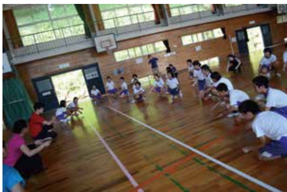
開催校は舩肥城内の小学校 残暑の中、子供たちがコンテンポラリー・ダンス（芸術文化）にトライ