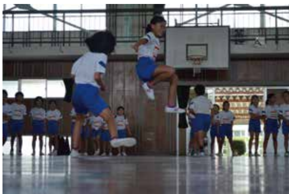
子供たちのジャンプの姿には驚きました。写真集にして学校にお渡ししました。

※〔実施校等〕〔実施内容〕〔講師〕〔主催等〕〔協力〕等は第1回～第3回と特に変更なし