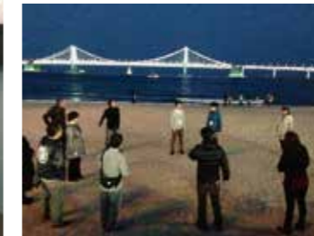
釜山のアート拠点を視察、海辺でダンスワークショップも実施。