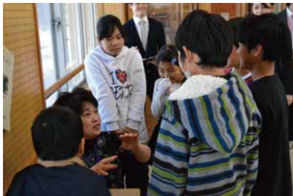
初コーディネート事業は音楽（合唱）でした。