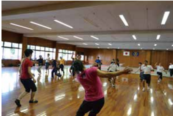
大学と芸術家が仕組んだのは“目からうろこ”の体験(現代芸術的体育)。