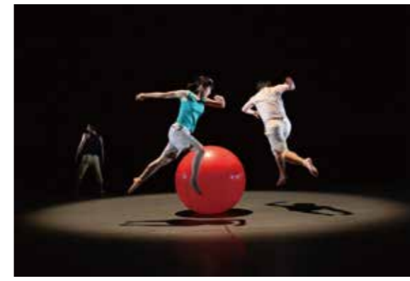
大学との連携・協力。指導者として、んまつーボスも富山へ！ 特別賞受賞！