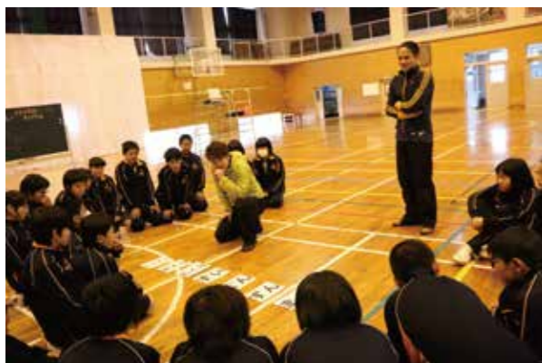
中学校保健体育における 複数の指導者による効果的な指導のあり方を探ってみました。