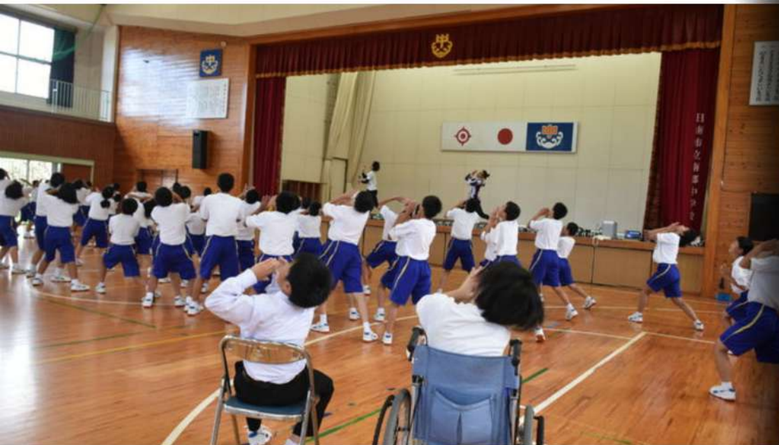
ダンスによるインクルーシブ教育の取組：33校