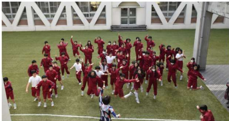
実施校：お茶の水女子大学附属中学校 実施対象：第1・2学年 240名 実施日：2019年12月2日、9日、10日（全3回）